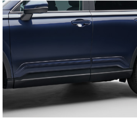
YAN GÖVDE KAPLAMALARI

CR-V'nizi daha şık ve pratik hale getiren Dayanıklılık Paketi, uzun yolculukları tercih edenler için düşünüldü. Paket, Yan Gövde Kaplamaları, Kapı Eşik Kaplamaları, Bölmeli Bagaj Zemini ve Dört Mevsim paspaslar içeriyor.