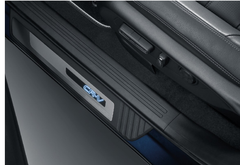
AYDINLATMALI KAPI EŞİĞİ KAPLAMALARI

Aydınlatma Paketi ile otomobilinizi geceleri ön plana çıkarın. Paket, CR-V'nin sofistike görünümünü artıran dış zemin aydınlatması, aydınlatmalı kapı eşik nikelajları, bagaj eşiği dekorasyonları ve iç kapı cebi aydınlatması içerir