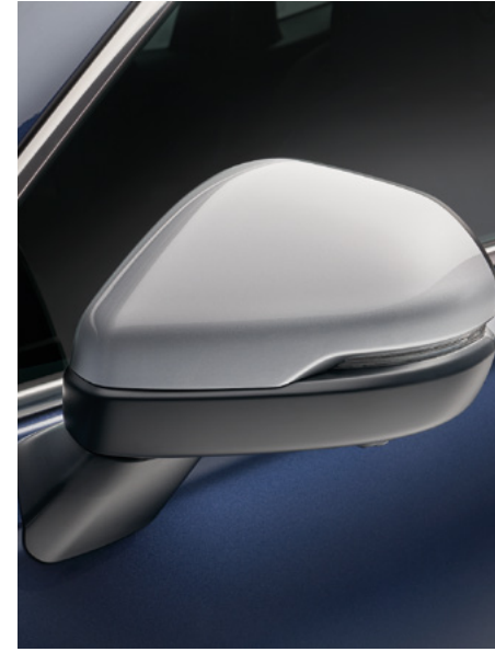
YAN AYNA KAPAKLARI