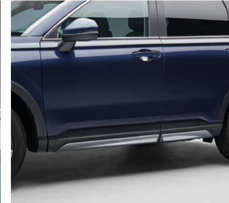
YAN MARŞPIYEL KAPLAMALARI