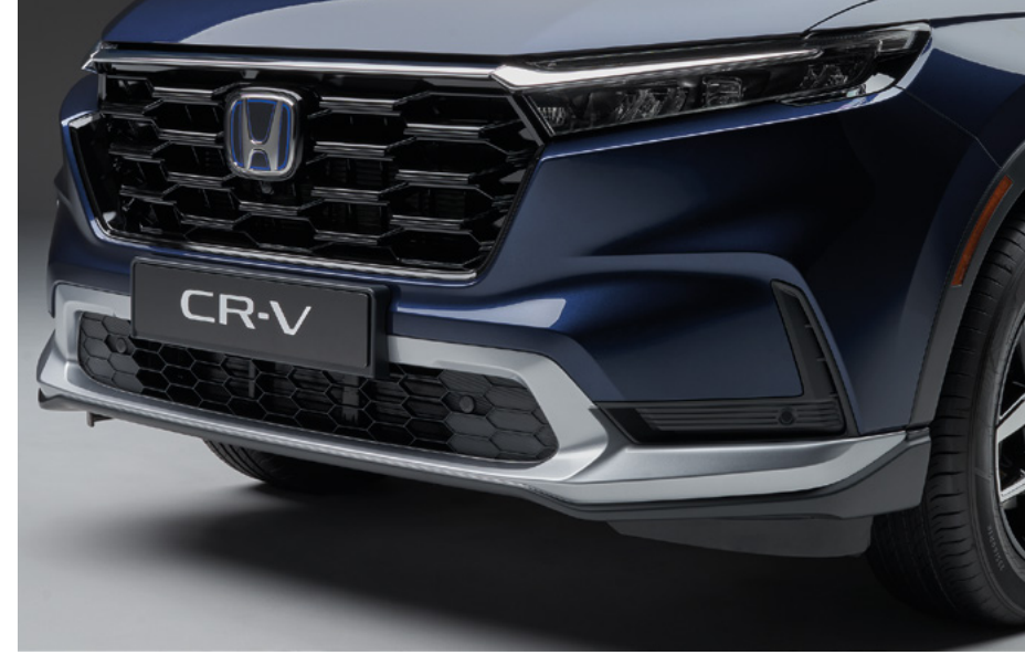
AERO ÖN TAMPON