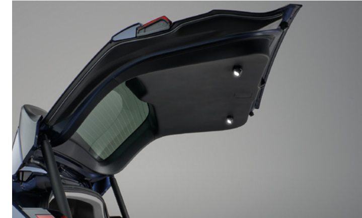
BAGAJ KAPAĞI AYDINLATMASI