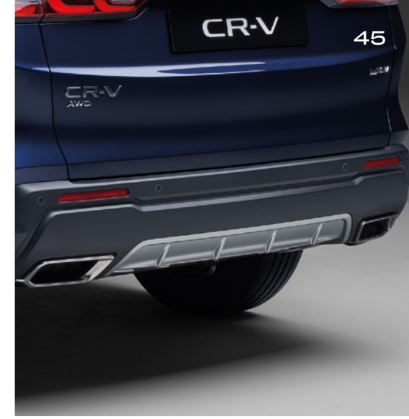
ARKA TAMPON EKİ