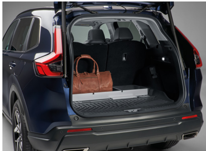
BÖLMELİ BAGAJ ZEMİNİ