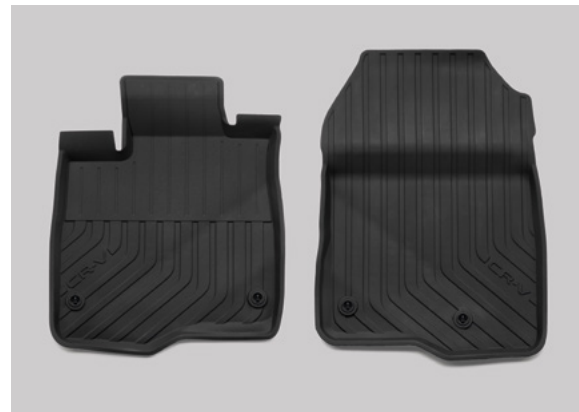
ÖN VE ARKA DÖRT MEVSİM PASPASLAR