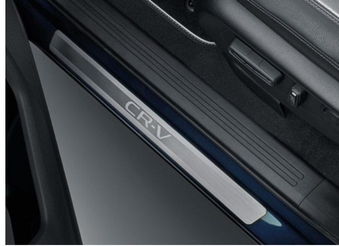
KAPI EŞİK KAPLAMALARI